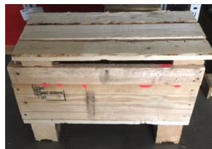
Abbildung 2: Wooden Box IPPC-Standard 1