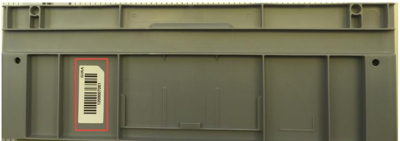
Figure 1: Gira-Barcodelabel

Wird vom Lieferanten eine Kennzeichnung auf einer Gira Mehrwegverpackung aufgebracht, so soll diese einfach und ohne Hilfsmittel rückstandslos entfernbar sein. Gira behält sich vor die Kosten zur Entfernung schlecht ablösbarer Etiketten dem jeweiligen Absender in Rechnung zu stellen. Die Gira-Barcodes auf den Mehrwegbehältern dürfen weder entfernt noch überklebt noch in sonstiger Art und Weise verändert werden (siehe Fig.1 )!